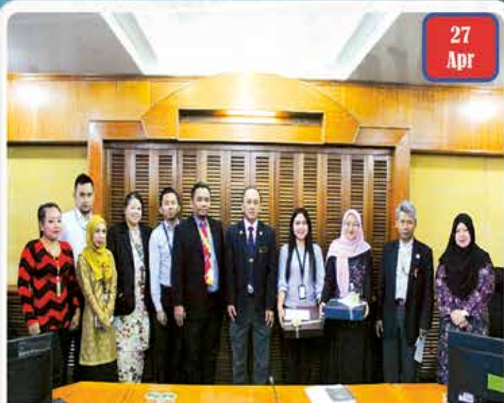
Majlis Penghargaan Pelajar Praktikal