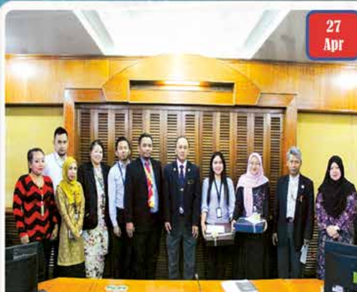
Majlis Penghargaan Pelajar Praktikal