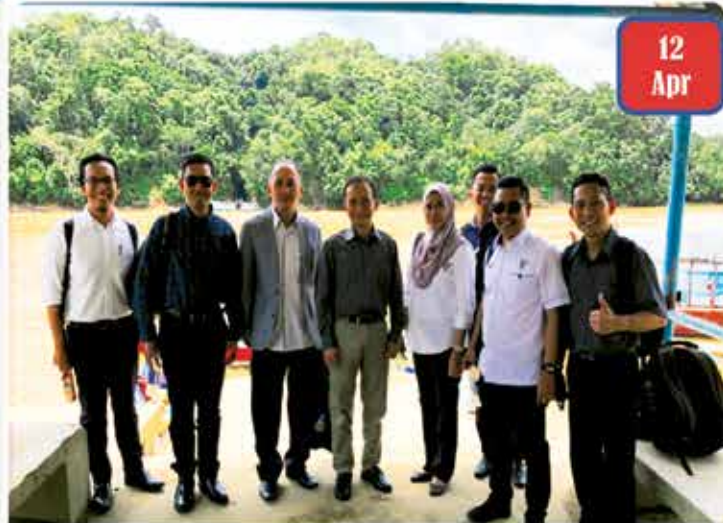
HR Visit, Kapit