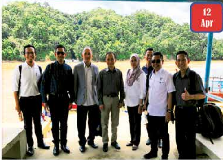
HR Visit, Kapit