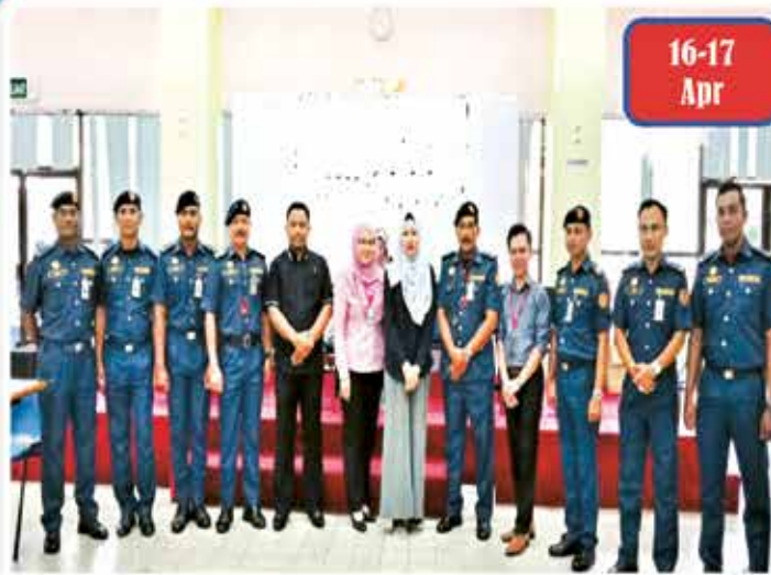
Ujian Fizikal dan Praktikal ,Gred KP19, KP11 dan H11 oleh L&S bertempat di Miri