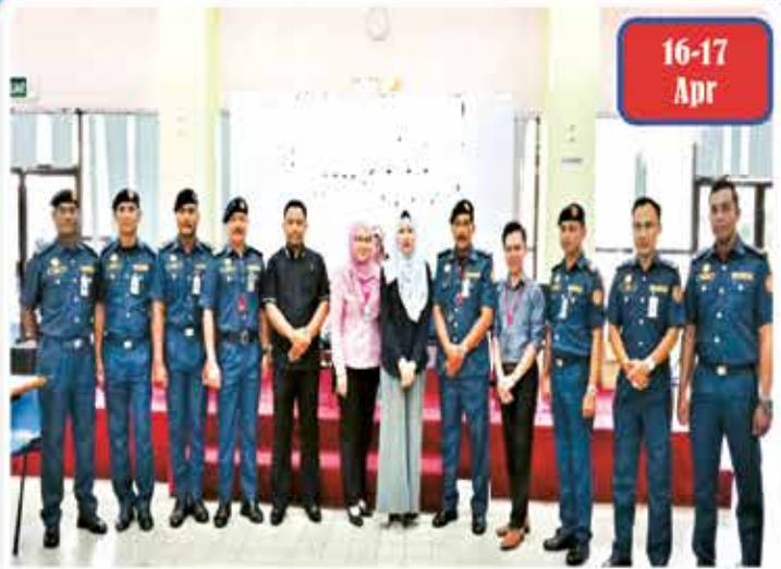
Ujian Fizikal dan Praktikal ,Gred KP19, KP11 dan H11 oleh L&S bertempat di Miri