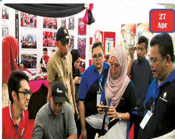
Sejiwa Senada 2018 - Miri