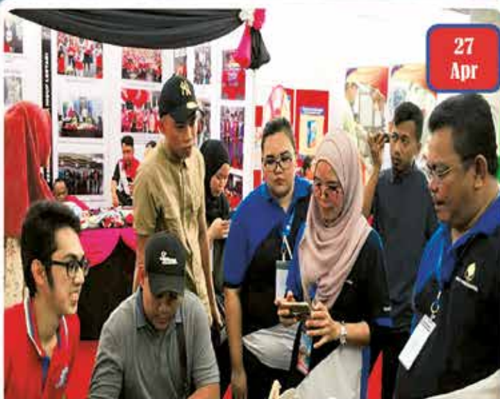
Sejiwa Senada 2018 - Miri